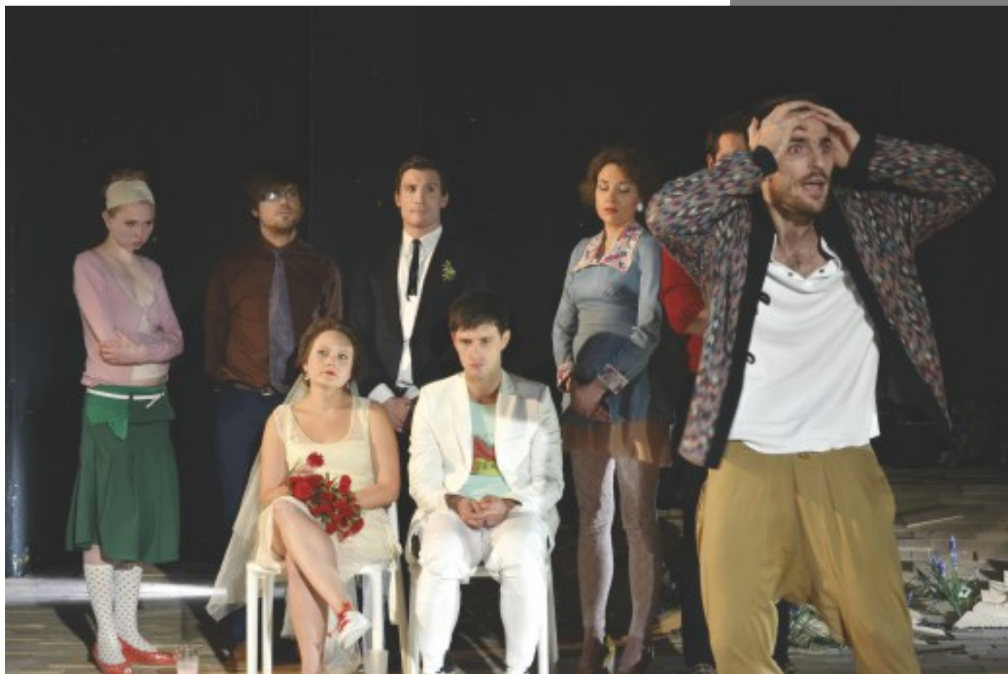
T. Wilder, Nasze Miasto , reż. Sz. Kaczmarek