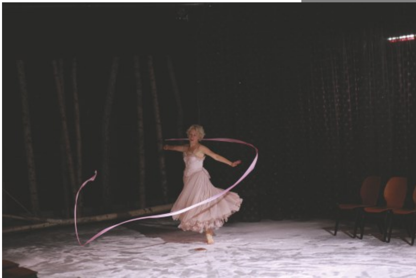
Mewa, wg A. Czechowa, reż. P. Miśkiewicz