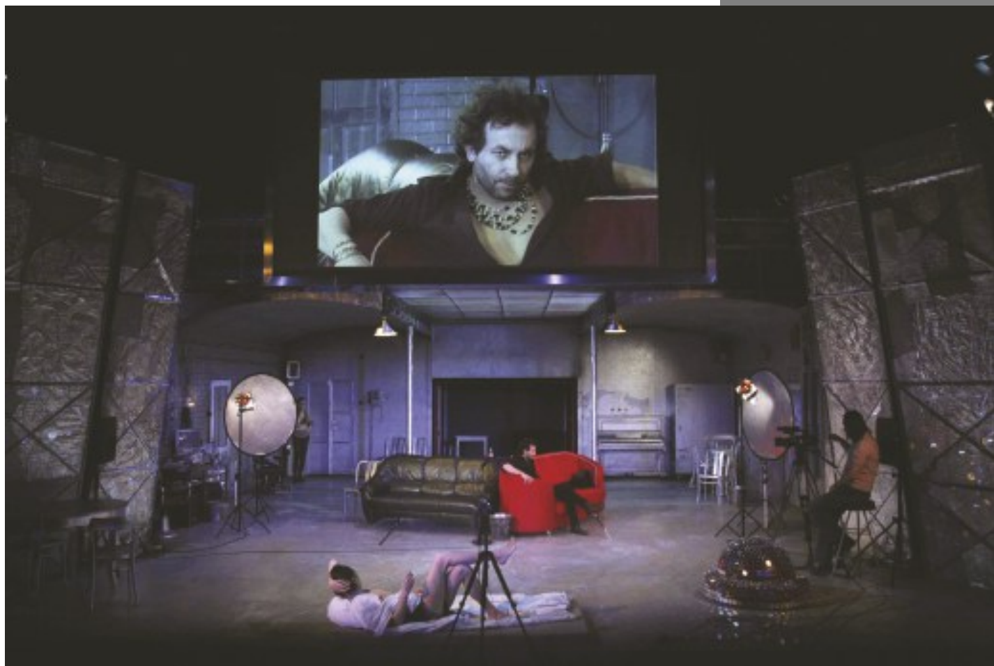
Factory 2, scen. i reż. K. Lupa