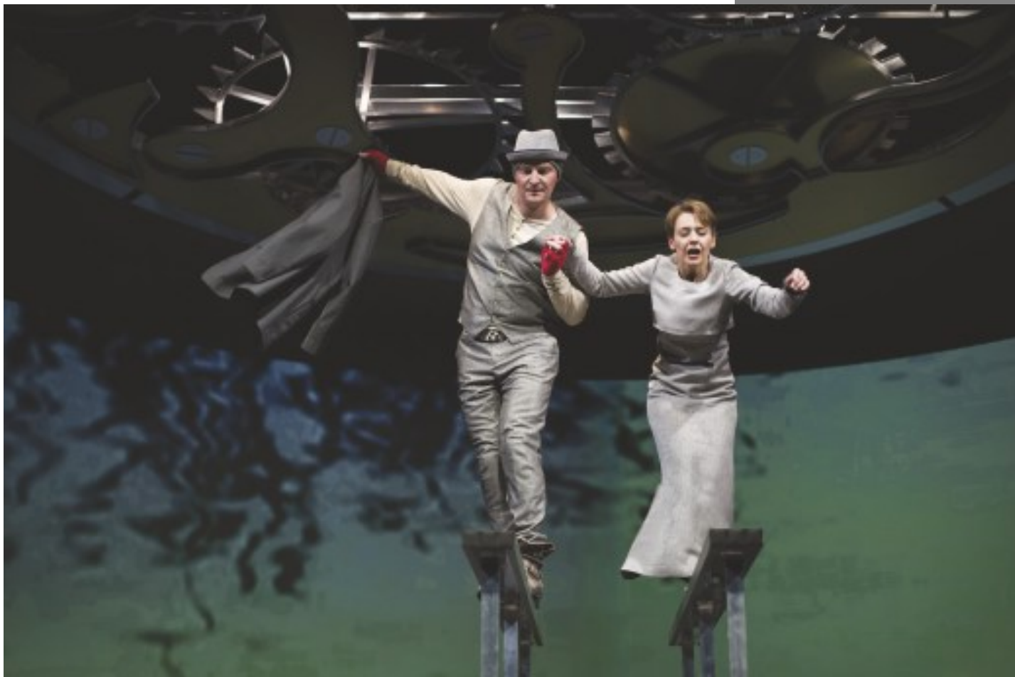
Koprolagi czyli znieprawidzeni ale niezbędni, wg J.Conrada, reż. J. Klata