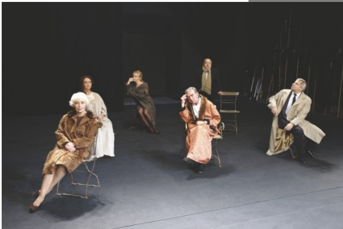
E. Ionesco, Król umiera, czyli ceremonie , reż. P. Cieplak