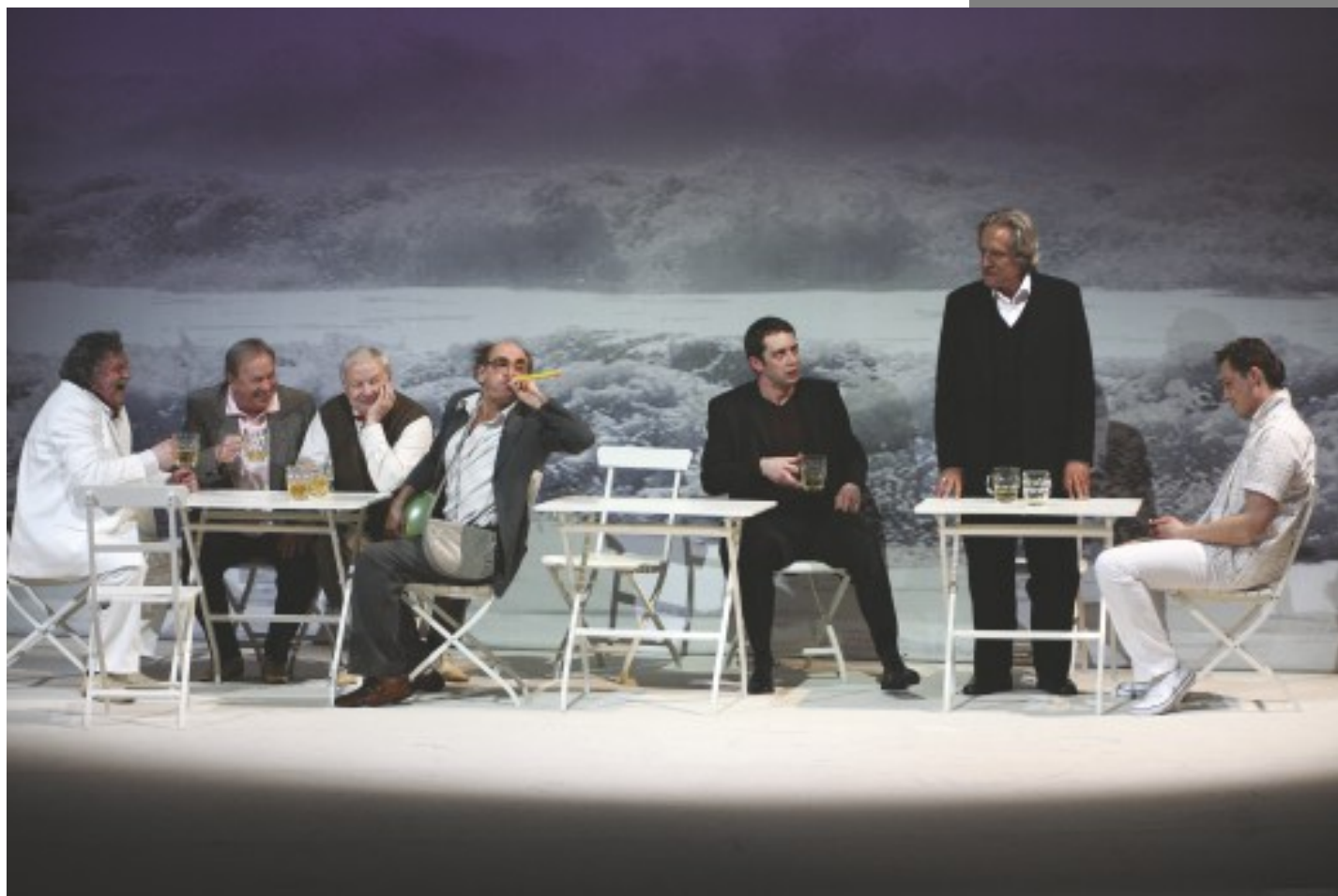
W. Gombrowicz, Trans-Atlantyk , reż. M. Grabowski